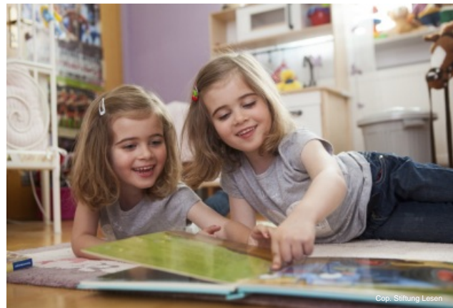
Cop. Stiftung Lesen